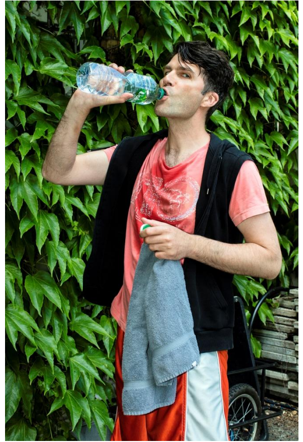
C 2017 cMEYER